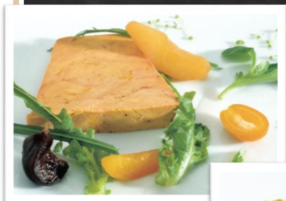
Foie gras mi-cuit Manoir Alexandre