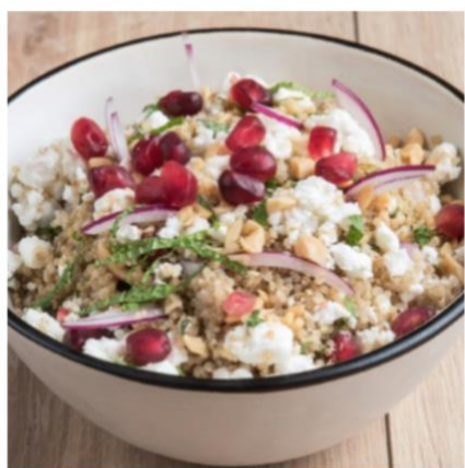
Salade de quinoa