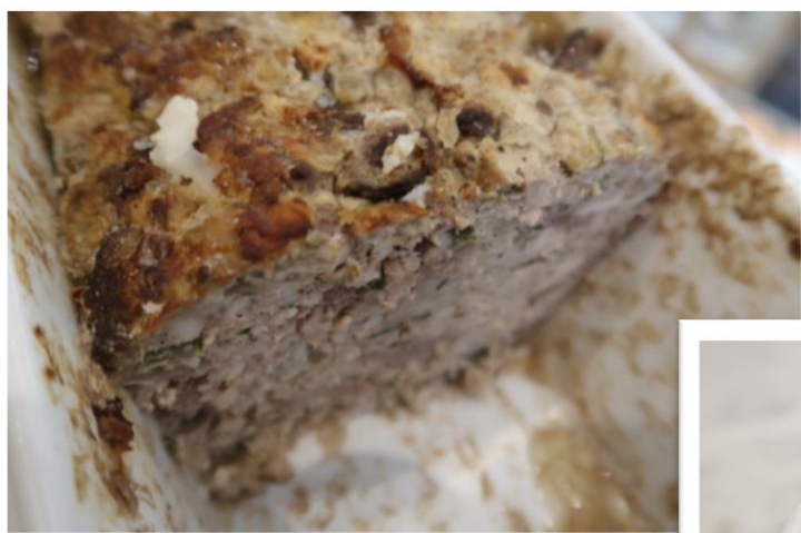
Terrine de campagne