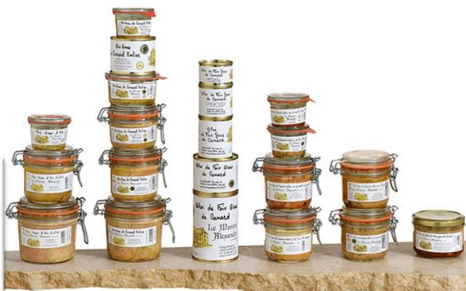
Foie gras entier Manoir Alexandre