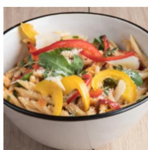
Salade de pâtes